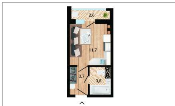
Квартиры-студии от 20,50 до 23 м 2