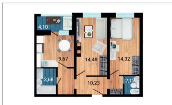
Двухкомнатные (от 56,55 м 2 до 69,39 м 2 )