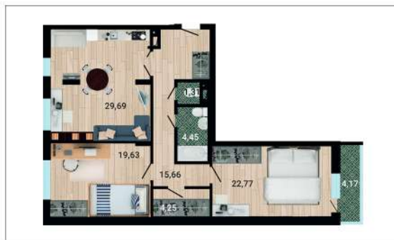
Евротрехкомнатные (99,84 м 2 )